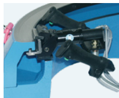
MZ 11 · MZ 15 · MZ 17