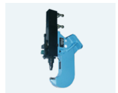
Stanzbügel / punching unit