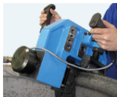
MKF 130/16 · MKF 140/32