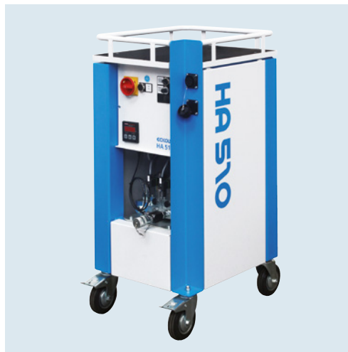
HA 510 Flexibel mit umfangreicher Modellpalette Flexible with an extensive range of types