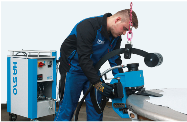
Hydraulikaggregat mit mobilem Kraftformer zum Bördeln. / Hydraulic drive unit with portable Kraftformer for flanging.