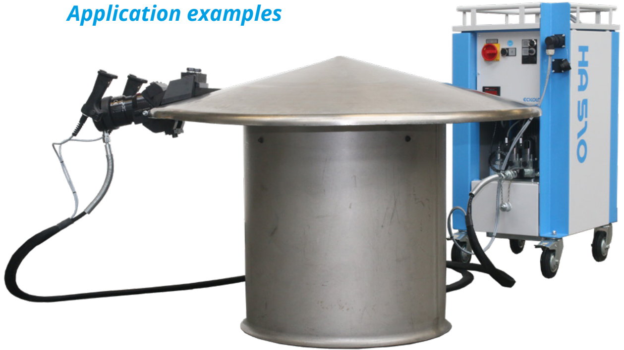
Hydraulikaggregat mit mobiler Zange zum Bördeln. / Hydraulic drive unit with portable pliers for flanging.