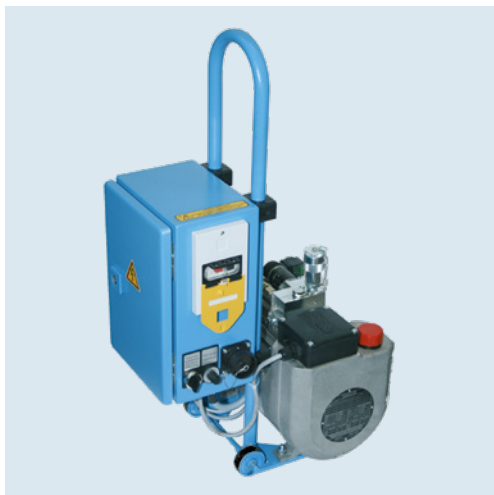
HAT 525 Die mobile Lösung / The portable solution

Depending on planned applications, hydraulic drive units in special and also stationary design can be added to our range of standard hydraulic drive units, which are field-proven in the best way.