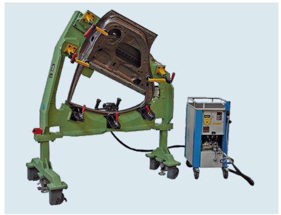
Hydraulikaggregat mit Falzzange / hydraulic drive unit with seamclosing pliers