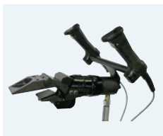
MZ 20 · MZ 30